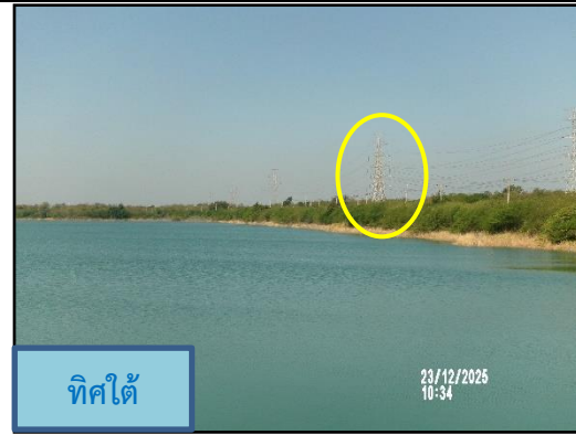
ภาพที่ 2.15 การเว้นระยะจากแนวสายไฟทางด้านทิศเหนือและทิศใต้