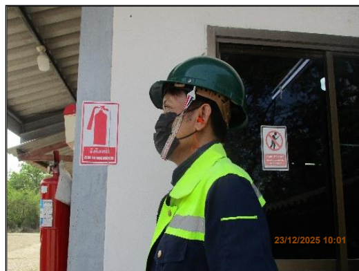
ภาพที่ 2.11 พนักงานสวมใส่อุปกรณ์ป้องกันอันตรายส่วนบุคคล