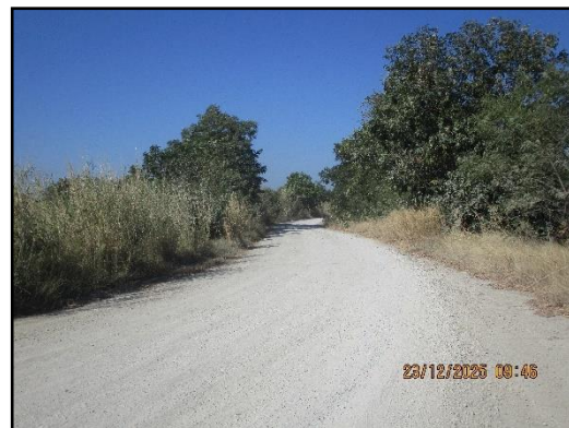
ภาพที่ 2.18 สภาพเส้นทางขนส่งแร่