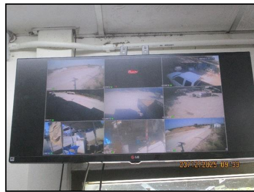
ภาพที่ 2.24 การติดตั้งกล่องวงจรปิดภายในพื้นที่โครงการ