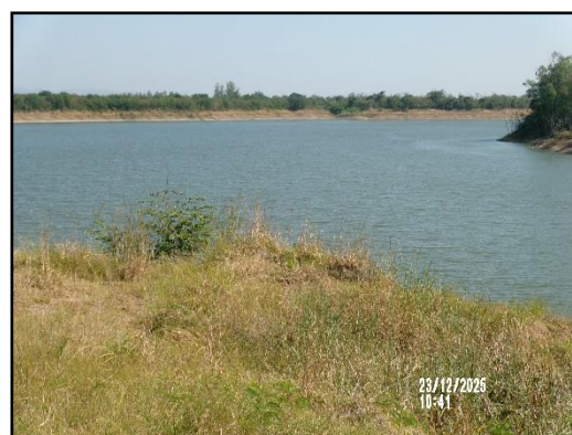
ภาพที่ 2.4 จุดรับน้ำเพื่อนำมาฉีดพรมถนนลำเลียงแร่