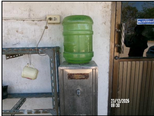
ภาพที่ 2.26 ตู้บริการน้ำดื่มภายในพื้นที่โครงการ