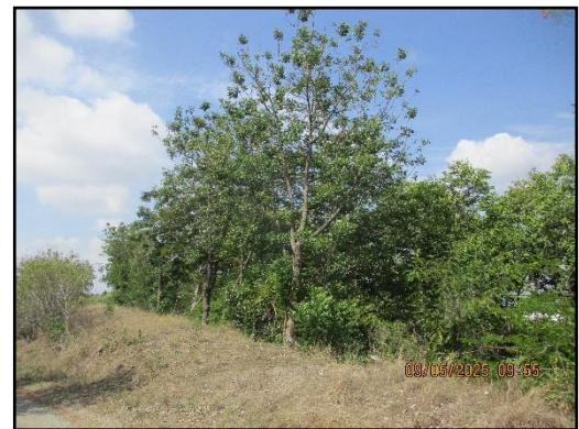
ภาพที่ 2.3 คันทำนบดินทางด้านทิศใต้ของพื้นที่โครงการ