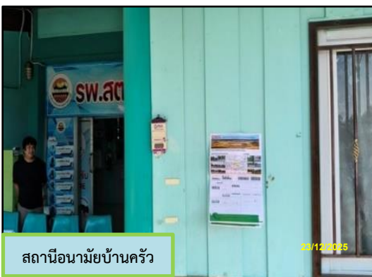
สถานีอนามัยบ้านครัว