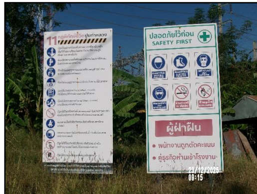
ภาพที่ 2.21 นโยบายความปลอดภัย อาชีวอนามัยและสิ่งแวดล้อมในการทำงาน