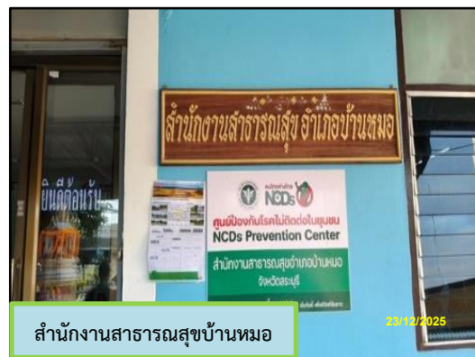
สำนักงานสาธารณสุขบ้านหมอ