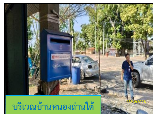
ภาพที่ 2.1 กล่องรับเรื่องราวร้องทุกข์