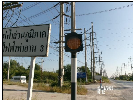
ภาพที่ 2.17 ป้ายจราจร และสัญญาณไฟให้ชะลอความเร็วบริเวณช่วงก่อนเลี้ยวเข้า-ออก พื้นที่โครงการ