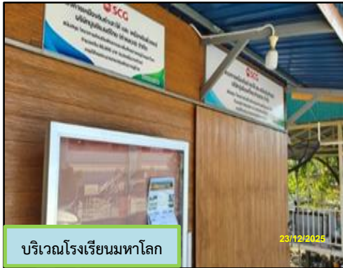
บริเวณโรงเรียนมหาโลก