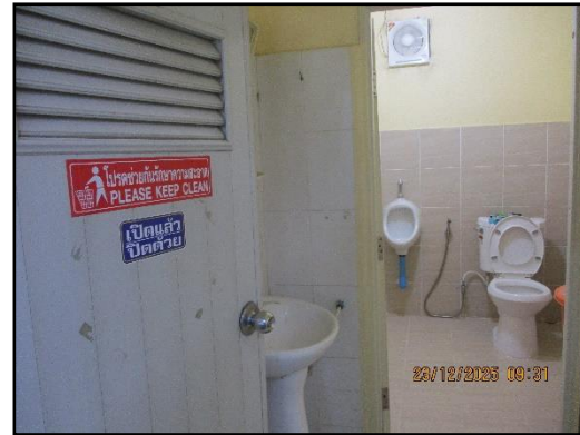
ภาพที่ 2.27 สุขาภายในพื้นที่โครงการ