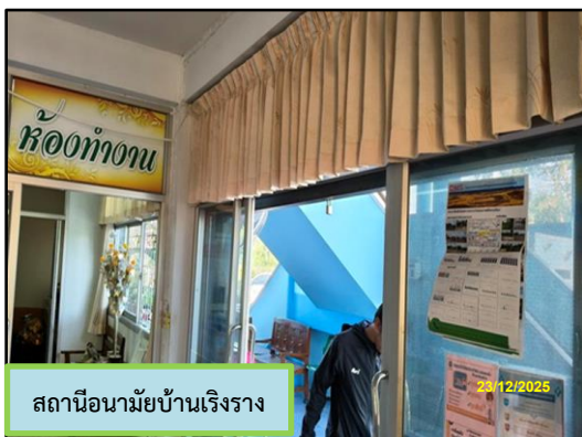
สถานีอนามัยบ้านเริงราง