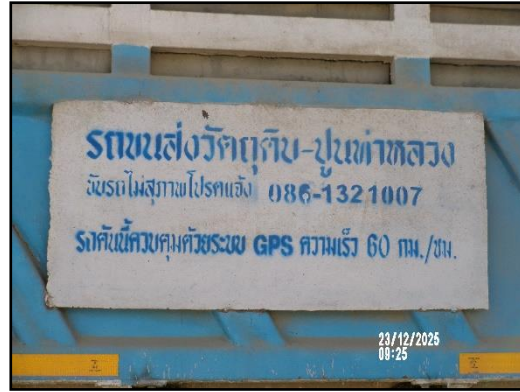
ภาพที่ 2.8 รถบรรทุกทุกคันที่มีการติดชื่อโครงการ และหมายเลขโทรศัพท์