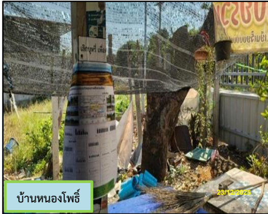
บ้านหนองโพธิ์