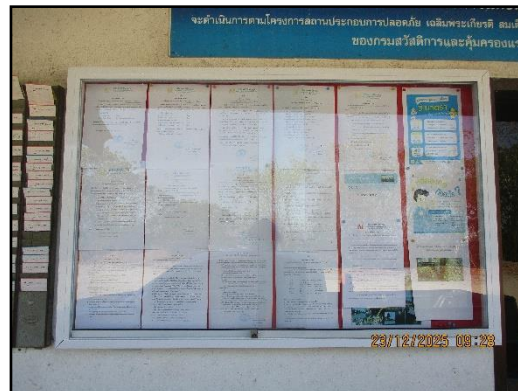
ภาพที่ 2.14 บอร์ดประชาสัมพันธ์ความรู้ต่างๆ ภายในพื้นที่โครงการ