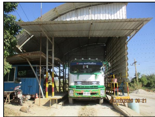
ภาพที่ 2.16 ด้านซ่งน้ำหน้ารถบรรทุกทุกขนส่งแร่