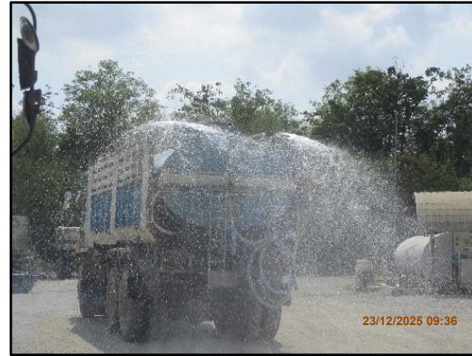
ภาพที่ 2.5 รถบรรทุกน้ำคอยฉีดพรมถนนภายในพื้นที่โครงการ