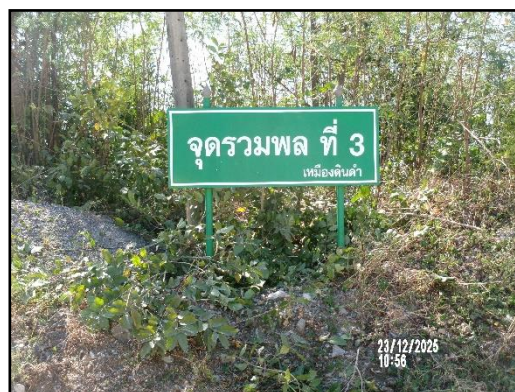
ภาพที่ 2.25 จุดรวมพลภายในโครงการ