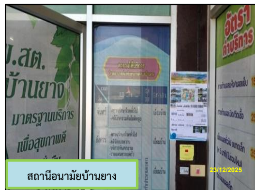
สถานีอนามัยบ้านยาง