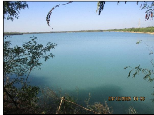
ภาพที่ 2.12 บริเวณพื้นที่กักขังน้ำขุ่นข้นและมูลดินทราย