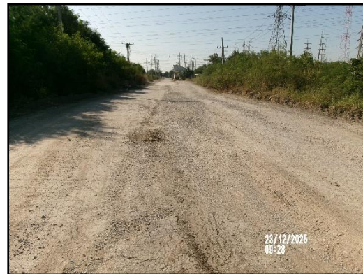
ภาพที่ 2.9 สภาพเส้นทางขนส่งแร่ (ส่วนบุคคล) ช่วงก่อนเข้าสู่ทางหลวง