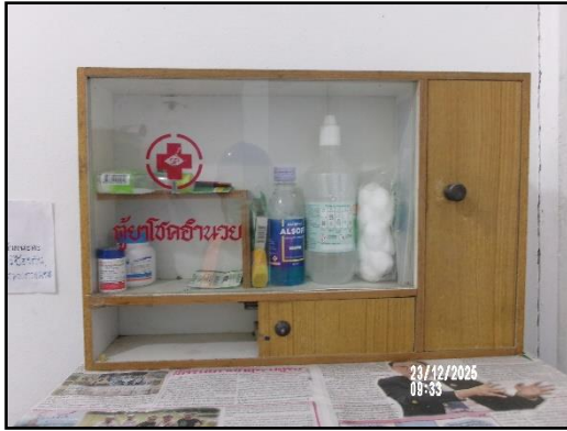
ภาพที่ 2.22 ตู้ยาปฐมพยาบาลเบื้องต้นประจำโครงการ