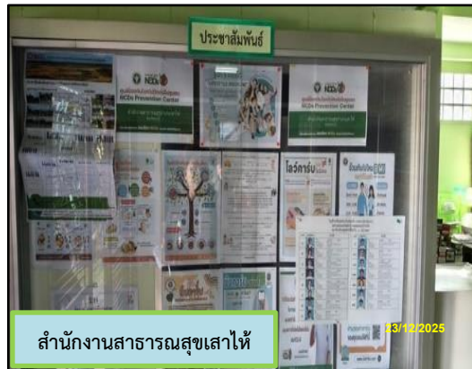
สำนักงานสาธารณสุขเสาไห้