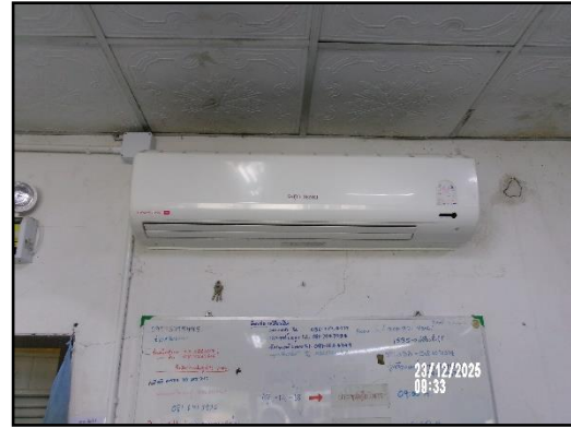
ภาพที่ 2.23 ห้องทำงานที่ติดตั้งเครื่องปรับอากาศ