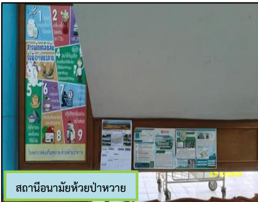
สถานีอนามัยห้วยป่าหวาย