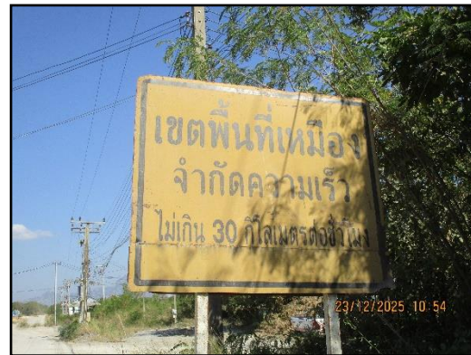
ภาพที่ 2.6 ป้ายจำกัดความเร็วไม่เกิน 30 กิโลเมตร/ชั่วโมง