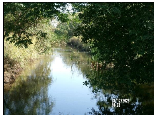
ภาพที่ 2.13 คูระบายน้ำด้านนอกคันทำนบ