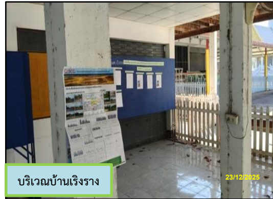
บริเวณบ้านเรีงราง