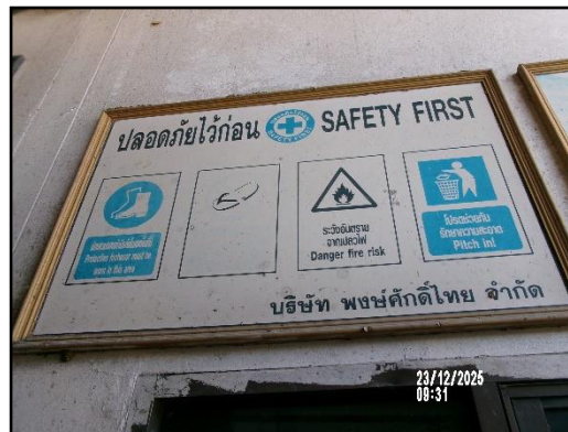
ภาพที่ 2.20 ป้ายเตือนบริเวณที่มีความเสี่ยงและกำหนดให้สวมใส่อุปกรณ์ป้องกันอันตรายส่วนบุคคล